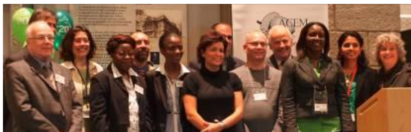
Les membres du CA, du Comité de prêt et de l'équipe de l'ACEM

Om Sakthi Import (prêt direct de 200$) : Om Sakthi Import est une entreprise enregistrée au Québec qui importe d'Inde des accessoires et des vêtements de femmes et de jeunes filles. Elle a ouvert un local commercial à Côte des Neiges en novembre 2010.