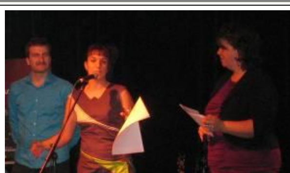
Réouverture du Bistro In Vivo